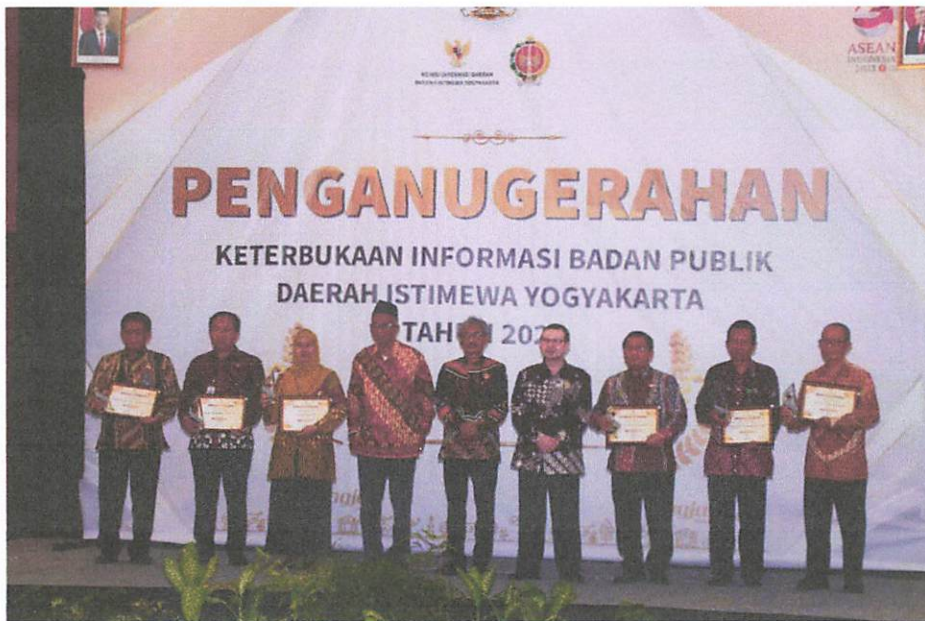
Penganugerahan Keterbukaan Informai Publik DIY Tahun 2023